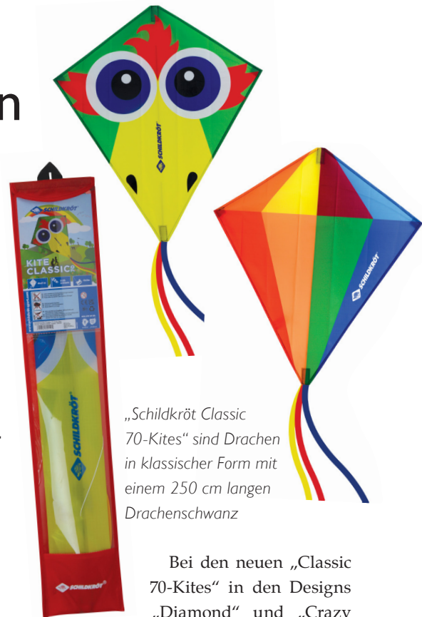
„Schildkröt Classic 70-Kites“ sind Drachen in klassischer Form mit einem 250 cm langen Drachenschwanz

Tasche ist er der ideale Begleiter für kleine Abenteuer und zudem sofort flugfertig und einsatzbereit. Der „Pocket Kite L“ kommt in einem 12er-Thekendisplay in drei assortierten Designs, hat eine 30 m lange Polyester-Leine mit Handgriff und garantiert Flugfreude bei einer Windstärke von 6 bis 28 km/h.